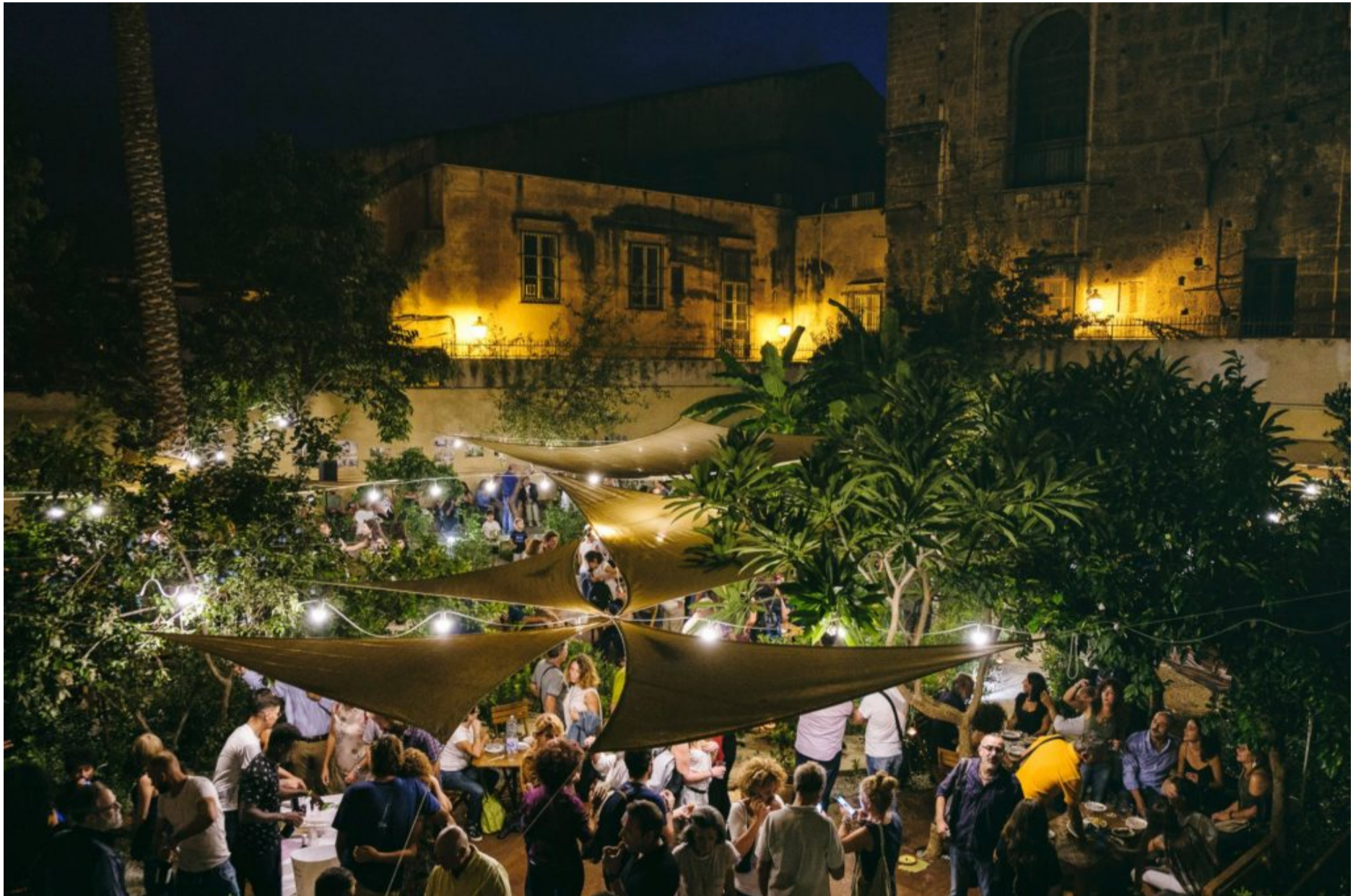
Il bistrot Al Fresco

Nel 2018 nasce, infatti, Al fresco , un bistrot che sorge all'interno del giardino di casa San Francesco, un ex infermeria dei Cappuccini del 600' nel cuore di Ballarò. Al fresco è dunque la seconda casa della cooperativa e si occupa della preparazione di cibo fresco, ma anche di catering su ordinazione per eventi privati e servizi aziendali. Al fresco è un bistrot solidale dove poter gustare tante prelibatezze con materie prime di alta qualità per una produzione Made in Sicily d'eccellenza.